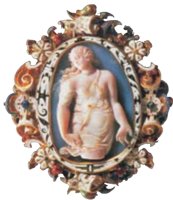
Jacopo da Trezzo, cammeo con Lucrezia, 1570 ca. Vienna, Kunsthistorisches Museum.

L'oro, il metallo prezioso per definizione, acquista valore solo dopo una serie di lavorazioni particolarmente accurate che lo trasformano in gioiello. Nei laboratori orafi, la maestria artigianale di mani sapienti trasformano l'oro, dopo molti passaggi, in seducenti ed originali catene, preziose anche per la raffinata esecuzione che enfatizza l'impiego di questo metallo. Conoscere il modo in cui vengono creati i gioielli è sicuramente interessante; scoprire i segreti della tradizione orafa ci può rendere in qualche modo più consapevoli allorchè ci troviamo di fronte ad una scelta di un monile o di qualsiasi oggetto prezioso, può farcelo apprezzare meglio, può permetterci di valutarne i pregi e i difetti, la raffinatezza di certi elementi, l'esclusività della fattura artigianale.