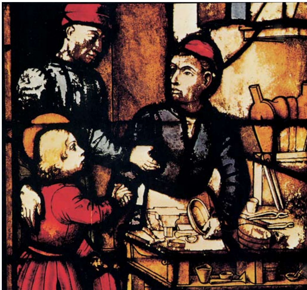
Nicolò da Varallo, vetrata raffigurante Sant'Eligio nella bottega di orefice. Milano, Fabbrica del Duomo