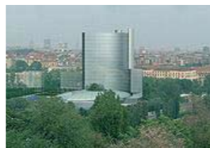
Il progetto del complesso del nuovo World Jewellery Center nell'area Portello di Milano.

Nella pagina accanto: Antonio Lafréry, Pianta di Milano, 1573. Milano, Civica Raccolta delle Stampe Achille Bertarelli