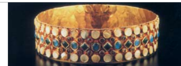
La Corona di Teodolinda, realizzata intorno all'anno Seicento (archivio del museo del Duomo, Monza)

La quantità d'oro estratto dall'inizio della storia dell'umanità ad oggi è stimata in circa 121 mila tonnellate; ogni anno si aggiungono circa tre mila tonnellate di nuova estrazione. Le miniere d'oro si trovano in Sudafrica, negli Stati Uniti d'America, in Australia; in Russia, nel Canada, in Cina, in Brasile, nelle Filippine.