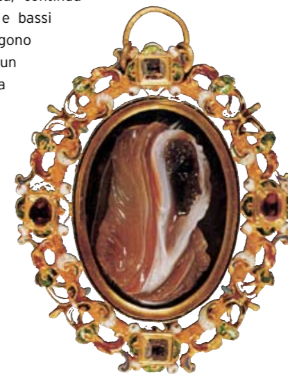
Qui accanto Laboratorio milanese, cameo con busto femminile; seconda metà del XVI secolo. Vienna, Kunsthistorisches Museum.

Nel quindicesimo secolo continua lo slancio dell'arte orafa milanese che culmina con la prestigiosa produzione sotto il ducato di Ludovico il Moro e Beatrice d'Este. Dopo il Concilio di Trento la produzione si specializza in arredi sacri (calici, pissidi, ostensori, croci) e suppellettili per i palazzi dei signori. La decadenza inizia nel Seicento e le produzioni si accentrano in poche insegne, resiste solo la fornitura per le case dell'aristocrazia che, nonostante la peste e la crisi economica, continua a vivere nel lusso e nello sperpero. Tra alti e bassi si arriva così all'epoca teresiana quando vengono censite (nel 1845) centodiciannove aziende e un buon numero di commercianti e incisori. Poi la storia dell'arte orafa milanese si fonde con il più ampio discorso delle esperienze regionali e la tradizione argentiera contribuisce tuttora al rinnovamento iniziato nel ventesimo secolo.