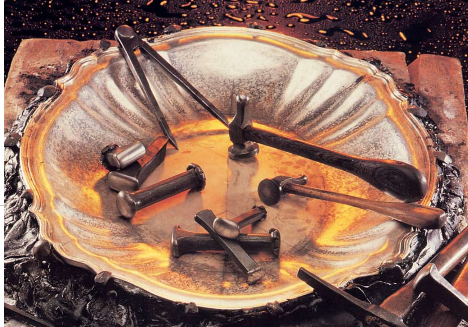
A destra Strumenti per la cesellatura dell'argento

A Milano e provincia è presente il maggior numero di imprese del settore orafa argenteria, circa il 10% del totale nazionale, inoltre Milano risulta fortemente caratterizzata dalla piccola dimensione delle imprese (il 70 % delle imprese non ha più di 2 addetti) e dalla tendenza a rimanere agganciati ad un modello tipicamente artigianale: lavorazioni manuali e tecnologie tradizionali.