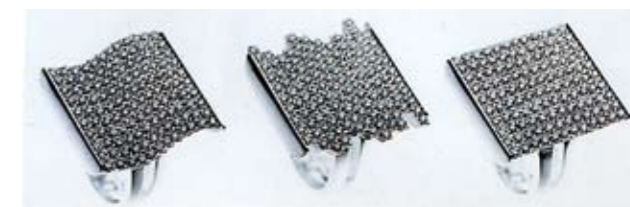
Anelli design Gabriele De Vecchi produttore De Vecchi, 2000